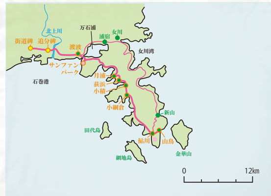
石巻市内～牡鹿半島・金華山街道の図

車は隣の小積に行く。浜沿いには民家は見えなく、防波堤工事の音が響く。ここからは2号線を外れる小積峠を確認した。ここは“みちのく潮風トレイル”（註3）のコースと重なるが、小さな掲示があるだけで、まだ潮風トレイルの積極的案内には至っていないようだ。踏査時の草木の状況から推察するのだが、夏から秋には草木で鬱蒼として、歩くのに往生するのではと思った。この峠は次の浜までのショートカットコースといえ