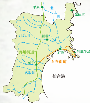
宮城県内の近世街道

一行はまず石巻の街道入口に建つ街道碑を確認することからスタートすることにし、北上川に架かる日和大橋を車で戻った。国道 45 号線から石巻街道と呼ばれている国道 398 号線に向かったところに大街道の十字路があり、ここの七十七銀行穀 いなしいし 町支店の前に明治 6 (1873) 年建立の「金華山道」の稲井石製