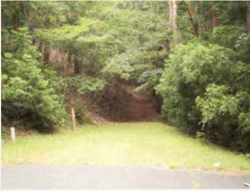
小積峠-みちのく潮風トレイル