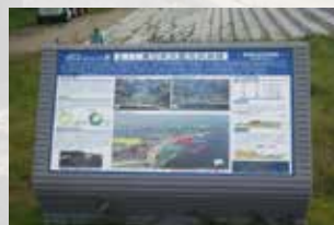
施設計画概要案内板（伝承板）

実物大のハザードマップとして地域住民のみならず地元の地理に不案内な観光客への津波防災意識の啓発を目的として設置しています。