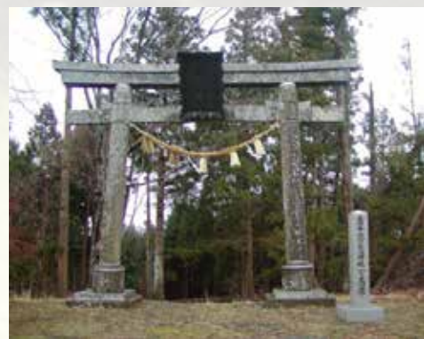
一ノ鳥居:金華山という神域への入り口として重要視されていた。