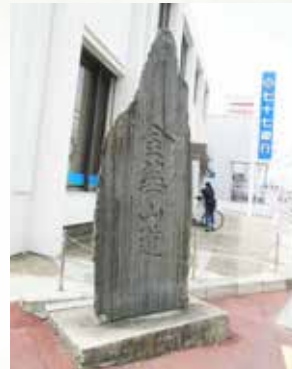
大街道角に立つ街道碑